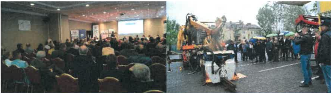
Fot. Obrady Konferencji

W wydarzeniu, łącznie udział wzięło ponad 200 uczestników, reprezentujących ok. 70 zakładów i instytucji a także goście honorowi m.in. z UTK, PKBWK, PKP SA, PLK, TDT, IS, SITK i wielu innych, w tym również z zagranicy, Niemiec, Austrii, Francji, Litwy. Ze strony PKP Polskie Linie Kolejowe S.A. Wzięło udział 18 delegacji na 23 Zakłady Linii Kolejowych oraz przedstawiciele Centrum Diagnostyki, Zakładu Maszyn Torowych i Przedsiębiorstwa Napraw Infrastruktury oraz ze wszystkich 4 Spółek zależnych. Program merytoryczny obejmował 24 wystąpienia, 2 debaty oraz pokazy sprzętu związanego ze zgrzewaniem, spawaniem oraz obróbką mechaniczną.